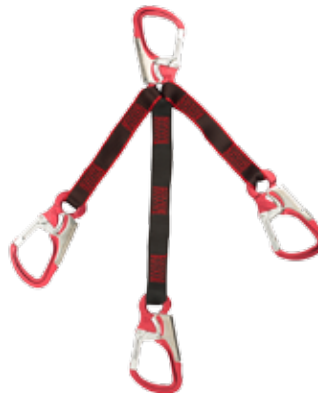
Nº3: Dispositivo de rescate Rescue webbing