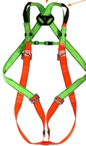
Nº2: Punto de extracción Extraction point