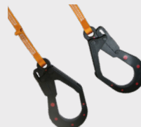
Conector mod. 31 Dieléctrico Connector mod. 31 Dieléctrico