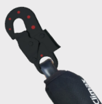
Conector mod. 32 Dieléctrico Connector mod. 32