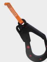
Conector mod. 31 Dieléctrico Connector mod. 31 Dieléctrico